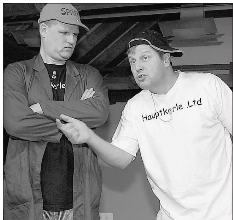
Urkomische Dialoge der „Hauptkerle“ sorgten am Samstag in Tiefenbach für Heiterkeit.

Die „Hauptkerle.Ltd“ trifft als verschlanktes Schwankstellen-Duo den Nerv des Publikums mit seinen etwas abstrahierten Alltagsszenen. Der Schlussapplaus wurde mehrmals mit „no oi gozzigs“ honoriert.